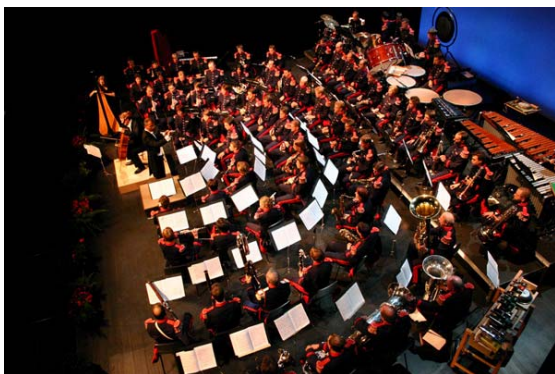
Une fosse d'orchestre

Une salle d'une capacité de 800 places assises