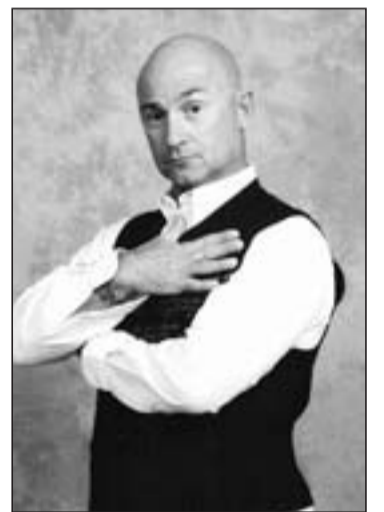
Vincent Lagaf' sera mardi à La Tour

La Tour-de-Trême, salle CO2, mardi 3 février, 20 h 30. Réservations: Office du tourisme de Bulle, 026 913 15 46, et Fribourg Tourisme, 026 350 11 00